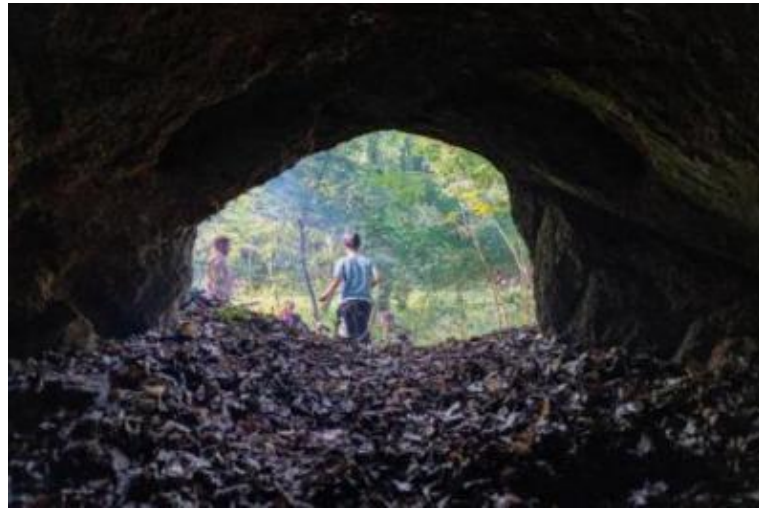
Kép 4: Csoportos és egyéni kihívások a “Bátorságpróbán”