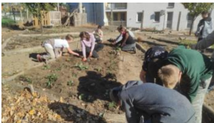
Kép 2: Kertművelés

Mindezek olyan képességek kibontakozását segítik elő, amelyek az ember által kialakított természeti világhoz való kapcsolódásukban szükségesek. A kertészet nem csupán egy különálló tantárgy a többi között, hanem sok szállal kapcsolódik a történelemből, földrajzból, irodalomból tanultakhoz. Az igényes kerttervezésnél felhasználhatók a geometriában tanultak. Az ásványtani ismeretek jó alapot szolgáltatnak a talajvizsgálathoz, biológiából a szaporodás, növekedés, fejlődés fázisai, valamint az elfogyasztható növények táplálkozás-élettani szerepe játszik fontos szerepet. Ez a fajta „egybeszóttóság” segít a gyerekeknek kapcsolódási pontokat találni, illetve egyre nagyobb rálátást nyújt a kertben végzett tevékenység sokrétű összefüggéseivel.”