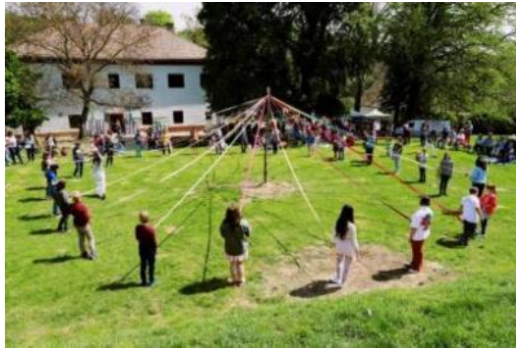
Kép 3: A közösség ünnepel (Pünkösd)

Az tanév folyamán számos ünnep kerül “megrendezésre” úgy mint: Szent Mihály ünnepe (megmérettetés, mérlegelés, számvetés napja) „Szent Márton ünnepe (önmagunk és mások felé fordulni tudás ünnepe) „Szent Miklós ünnepe, Pünkösd (felhangzás ünnepe), Szent György ünnepe (az iskolai közösség nyilvános vásári forgataga), stb. Az ünnepek a hagyományos közösségépítő szerepe mellett másfajta kihívások, pl. szociális kapcsolatok építésének kihívásai elé is állítják a iskolai közösséget, tanulókat, pedagógusokat, szülőket. Az ünnepvárás meghatározó része a készülődés és a várakozás időszaka, a pedagógusok ezek során sokféle szociális készséget és képességet tudnak fejleszteni, életre hívni. Az osztályokban mind a főoktatáson, mind a szakórákon elindul a közös munka, mely során a gyerekek az életkori sajátosságaiknak megfelelő szerepet vállalnak.