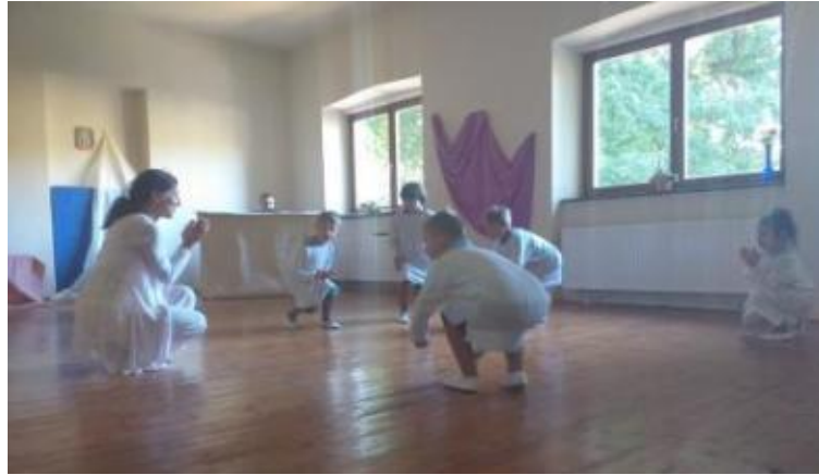
Kép 1: Eurythmia óra második osztályban